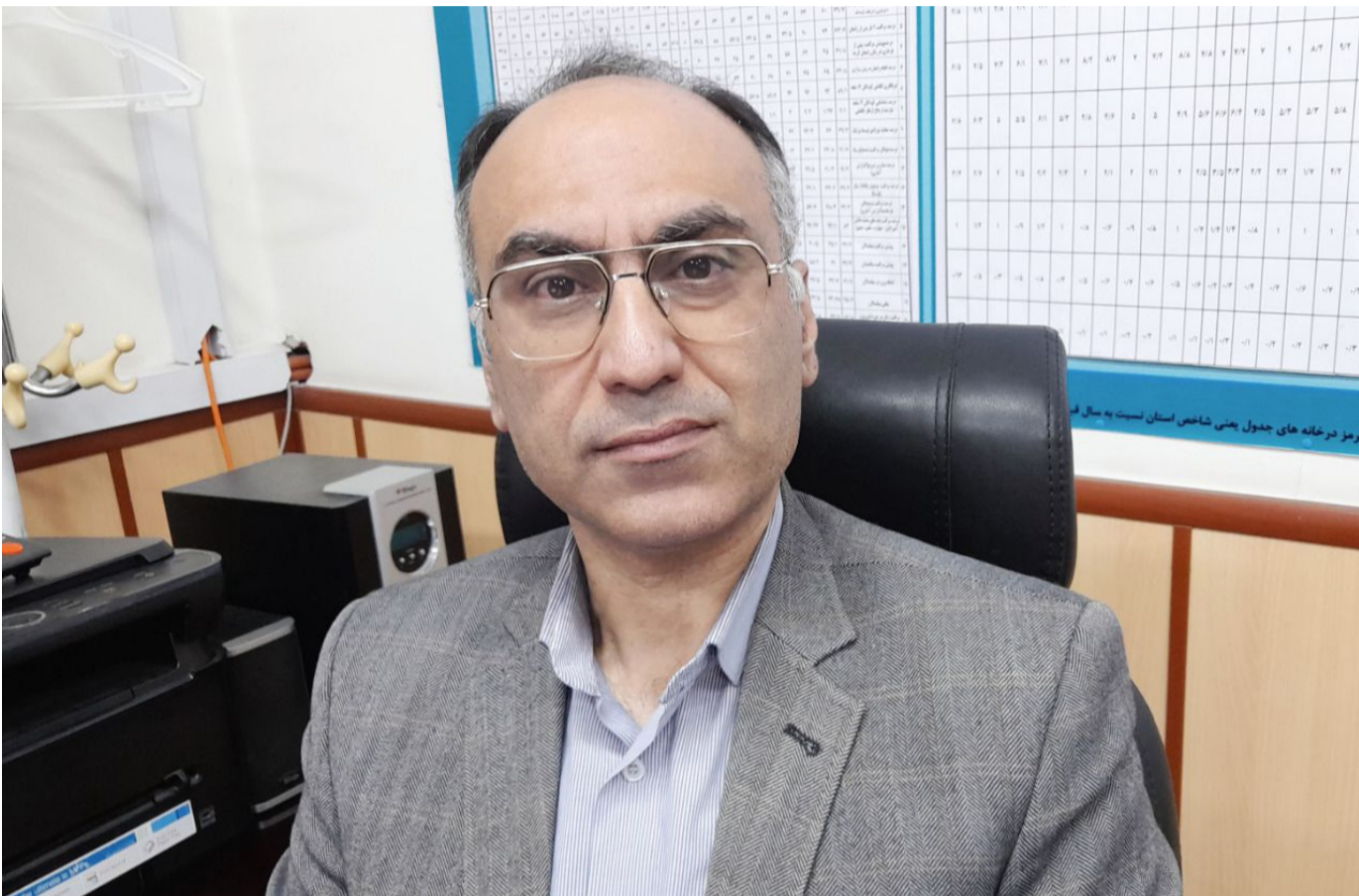
هفته سلامت مناسبتی است که سالانه در اردیبهشت ماه جهت ترویج مفاهیم کلیدی سلامت و گفت‌ماند سازی در جامعه و سیاستگذاران و ذی‌نفعان با تأکید بر اولویت‌های ملی سلامت برگزار می‌شود.

امسال با عنایت به اولویت‌های ملی و فرمایشات و تأکیدات مکرر مقام معظم رهبری (مد ظله العالی) در تقویت بهداشت و پیشگیری و بهره‌گیری از مشارکت مردم در بهداشت و همگام با سایر کشورهای جهان در شعار بین‌المللی دعوت به اقدام همگانی کشورها برای توسعه خدمات سلامت و پوشش همگانی سلامت و توجه به حقوق اقلیت آسیب‌پذیر و با توجه به اولویت وزارت بهداشت در برقراری عدالت در سلامت و اجرای برنامه ملی سلامت خانواده و نظام ارجاع و دست‌آوردهای شبکه بهداشت کشور شعار هفته سلامت در هفته اول اردیبهشت سال ۱۴۰۳ سلامت خانواده با مردمی‌سازی سلامت اعلام شده است. در همین راستا روابط عمومی دانشگاه علوم پزشکی مازندران در راستای اطلاع‌رسانی و ارتقاء سطح آگاهی مردم دیار همیشه سبز مازندران نسبت به میزان سلامتی خود و حفظ این گوهر ارزشمند دست به امری مهم زده و با ترویج فرهنگ خودمراقبتی سعی بر بالا بردن سطح سلامت مردم مازندران دارد. در گزارشی که می‌خوانید کارشناسان و متخصصان این دانشگاه نکات مهمی را در ارتباط با ضرورت جدی گرفتن توصیه‌های سلامتی همچنین نقش آن در سلامت فردی و اجتماعی مردم جهت ارتقاء سطح سلامتی و داشتن زندگی سالم را مورد توجه قرار داده است که توجه به آن می‌تواند در حفظ سلامتی ساکنان مازندران و هم‌استانی‌های عزیز نقش مهمی را ایفا کند.