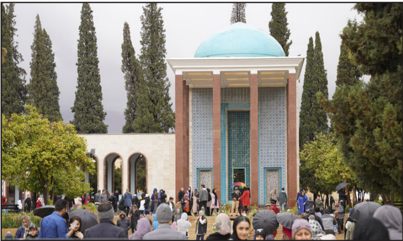
گردشگران در آرامگاه سعدی - روز سعدی