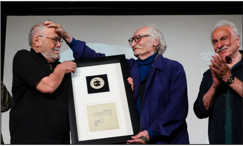
نکوداشت اکبر زنجان پور در نوزدهمین شب کارگردان