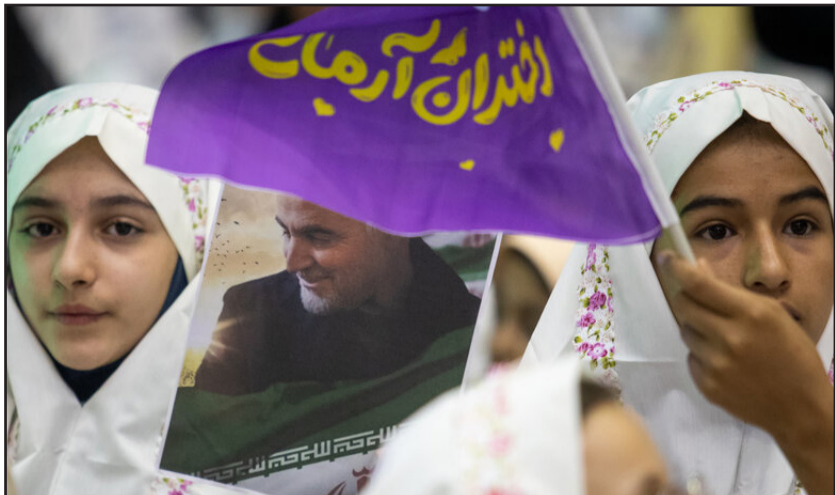
جشن بزرگ دختران آرمانی