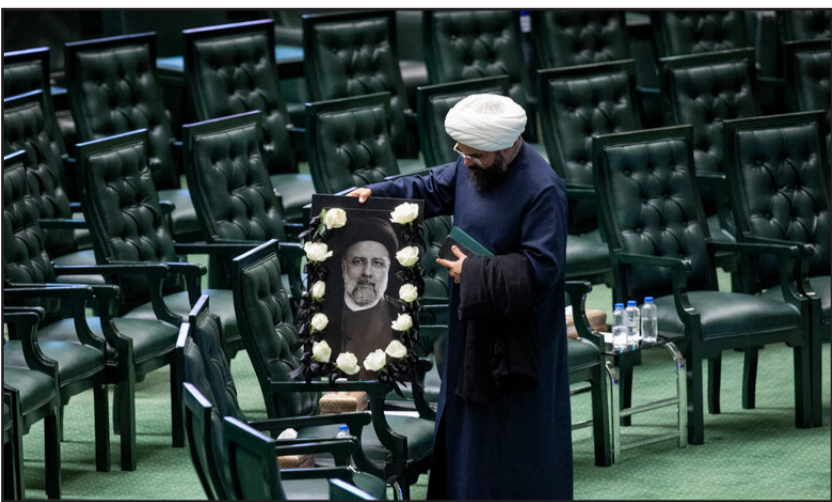
مراسم گشایش مجلس دوازدهم در صحن علنی مجلس شورای اسلامی