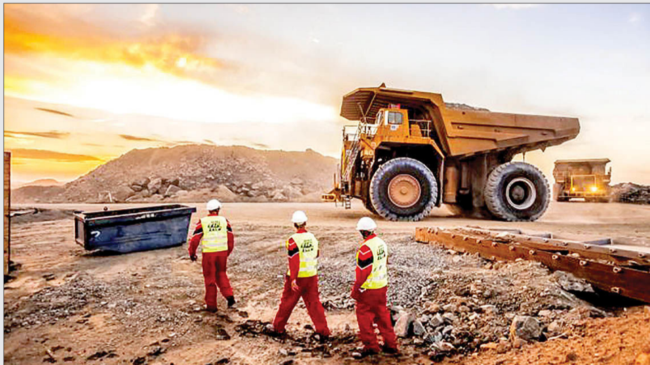
سید محمد قیصری - ایده روز - مرکز آمار ایران اعلام کرد: در اردیبهشت ماه امسال، تورم ماهانه بخش های صنعت و معدن نسبت به ماه قبل از آن به ترتیب یک واحد در صد و ۵، واحد در صد کاهش داشته است.