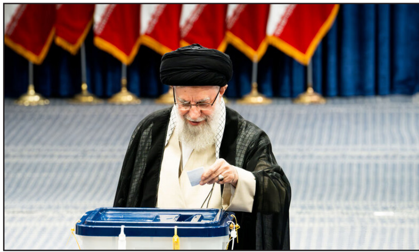
حضور رهبر معظم انقلاب در چهاردهمین دوره انتخابات ریاست جمهوری

اصحاب امتیاز و مدیر مسئول: سید مهدی قیصری ادبیر تحریریه: سعیده محمد تحریریه: محمود رضایی، آرزو بهانی زهرا جعفری اسازمان آگهی ها: سید محمد قیصری انسانی: تهران، میدان توحید، خیابان شهید بداله امیر لولو (گلبار)، پن بست خودرو، بلاک ۳ اکد پستی: ۱۴۱۹۷۳۴۶۱۴ تلفن، واتس آپ و نمابر: ۶۶۵۶۳۸۳۰ اسازمان آگهی ها: ۰۲۱-۶۶۵۶۳۸۳۰ اچاپ: شاخه سبز ا توزیع: نشر گستر امروز ا جی میل: Eidehrooz@gmail.com