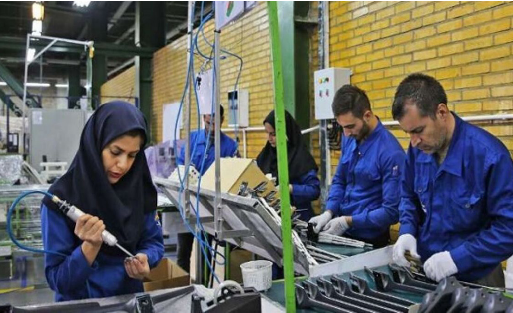
کارگران در خط تولید در یک کارخانه تولیدی

سعیده محمد – ایده روز | در بهار سال ۱۴۰۳، تعداد شاغلان حدود ۱۲ برابر تعداد بیکاران بوده و نرخ اشتغال در بازار کار کشور حدود ۵ برابر نرخ بیکاری کشور بوده است. داده‌ها حکایت از روند رشد مثبت شاخص‌های بازار کار در بهار سال جاری نسبت به سه فصل پیش خود دارد. گزاره‌ای که بهبود بازار کار را یادآوری می‌کند.