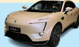
انقلابی در بازار خودروهای برقی

شیده‌ها حکایت از این دارند که خودرو جدید داجیا قرار است جایگزین نسخه استپ وی داجیا ساندرو شود. ساندرو استپ وی بین محصولات موفق داجیا جا می‌گیرد و در واقع دو سوم کل