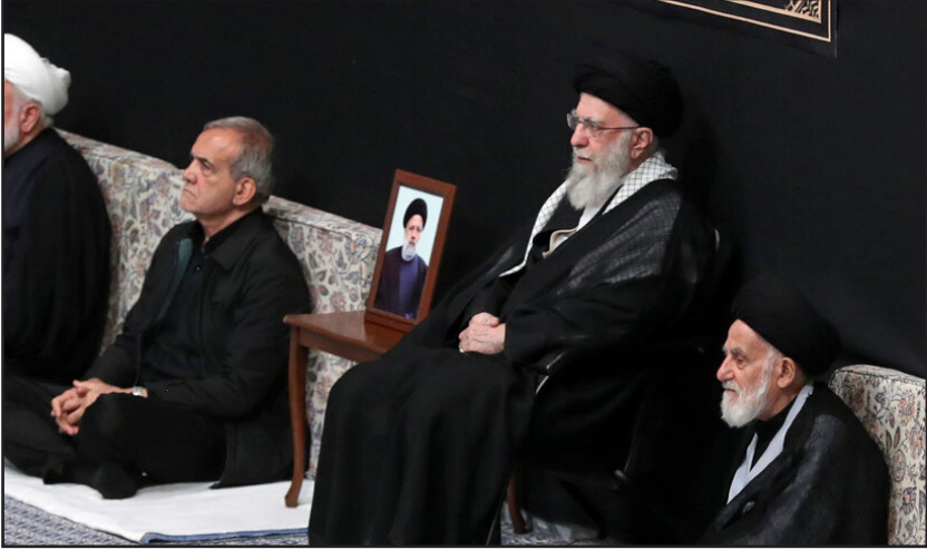
مراسم عزاداری حضرت اباعبدالله الحسین علیه‌السلام در حسینیه امام خمینی