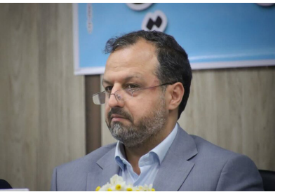
وزیر اقتصاد در نشست با اعضای هیئت مدیره بانک مرکزی

وزیر اقتصاد گفت: تلاش ما این بود که شورای ثبات مالی ایجاد کنیم که با مخالفت دو دستگاه این امر عملی نشد اما به جای آن، مرکز تسهیل تأمین مالی تولید در چارت اقتصاد جامعی‌شد. احسان خاندوزی وزیر اقتصاد در آئین افتتاح مرکز تسهیل تأمین مالی وزارت امور اقتصادی و دارایی و رونمایی از سامانه جامع تسهیلات اشتغالزایی با اشاره به عدم ایجاد شورای ثبات مالی در دولت سیزدهم به دلیل مخالفت دو دستگاه، گفت: تلاش ما این بود شورای ثبات مالی را اجرایی کنیم که با مخالفت دو دستگاه مصوب نشد. اما به هر حال هم اکنون مرکز تسهیل تأمین مالی تولید در چارت رسمی وزارت اقتصاد مصوب شده و جامعی‌ای شده داریم.