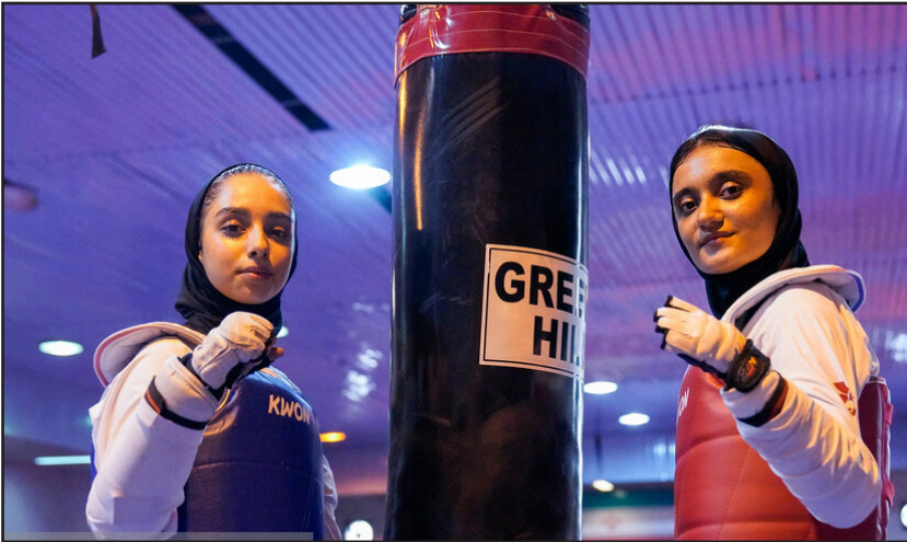
اردوی تیم ملی پاراتکواندو باتوان