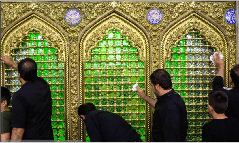
غبار رومی حرم حضرت فاطمه معصومه (س) توسط خبرنگاران قمی