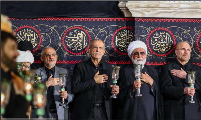
مراسم خطبه خوانی شب شهادت امام رضا (ع)