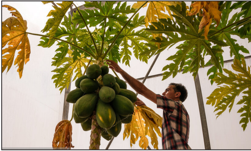
پرورش میوه پایا در دزفول