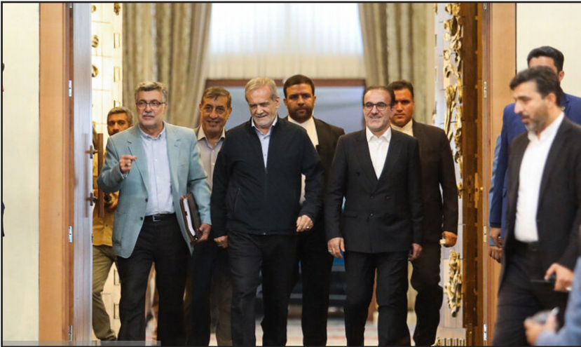
مسعود پزشکیان رئیس جمهور در مراسم روز پزشک