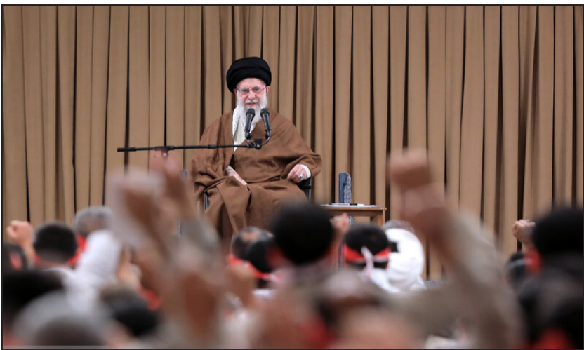
دیدار هزاران نفر از بسیجیان با رهبر معظم انقلاب