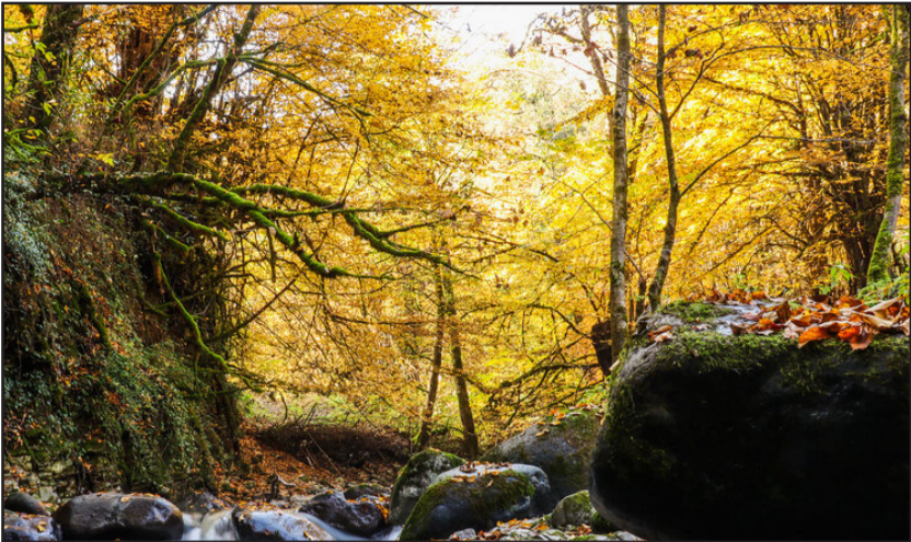
استان گیلان در فصل پاییز