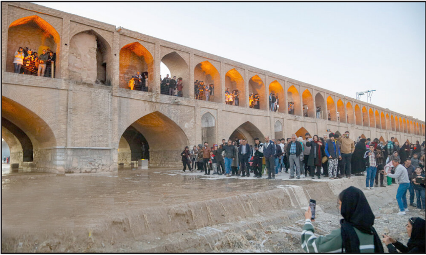
بازگشایی موقت زاینده رود اصفهان