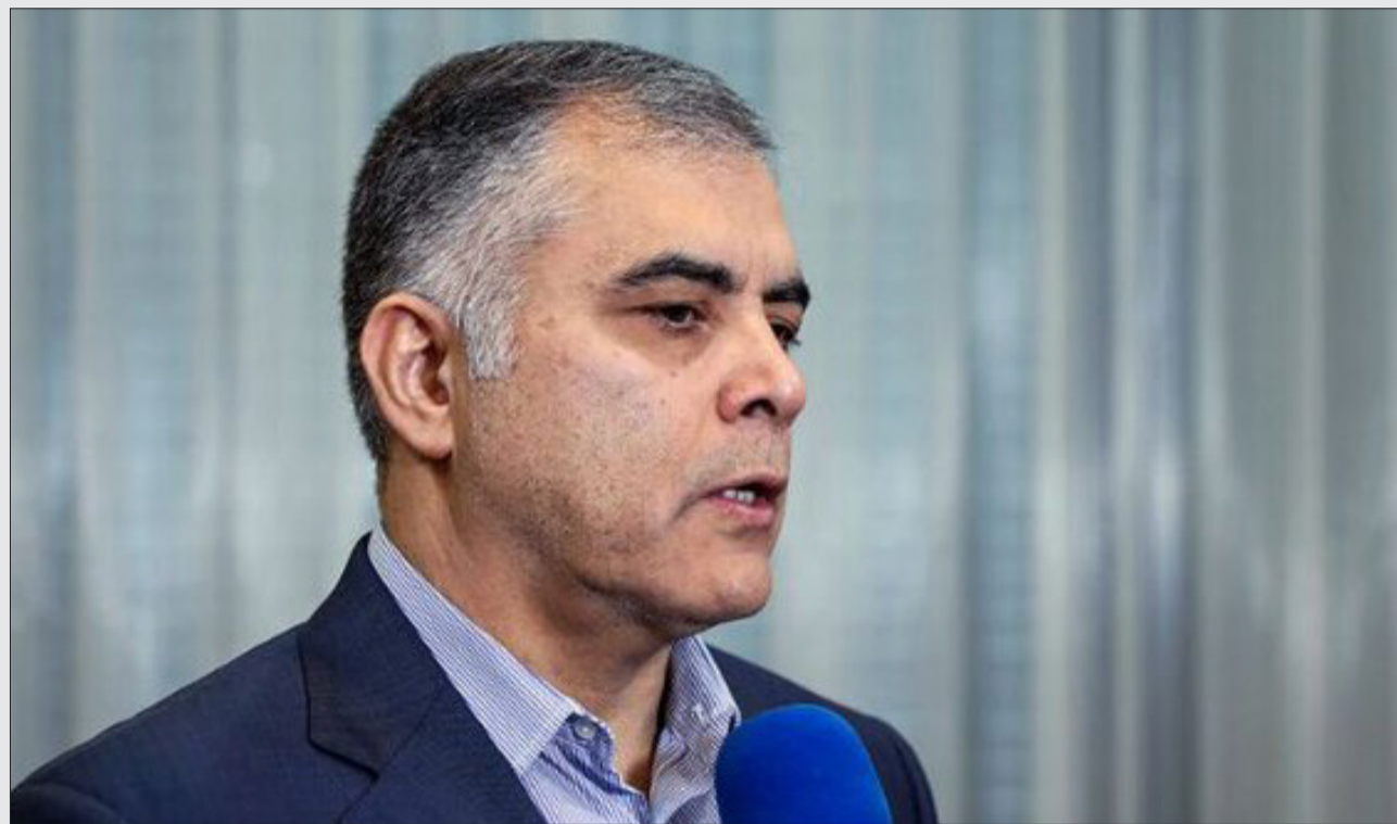
سید محمد قیصری - ایده روز - وزیر نفت با بیان اینکه در کنار سرمایه‌های جدیدی در تأمین سوخت هستیم، از تحویل روزانه ۵۰ میلیون لیتر نفت گاز به نیروگاه‌ها خبر داد.

محسن پاک‌نژاد در آئین امضای تفاهم‌نامه سازمان بسیج مستضعفین با وزارتخانه‌های نفت و نیرو با بیان اینکه بدون شک بسیج نماد و یکی از ارکان نظام جمهوری اسلامی است، ادامه داد: رهبر معظم انقلاب اسلامی به این نکته اشاره دارند که در هر عرصه‌ای که بسیج ورود کرده، کارهای بزرگ و غیرممکن به نتیجه رسیده و این همان انتظاری است که وزارت نفت و نیرو در این روزهای سخت از بسیجیان دارند.