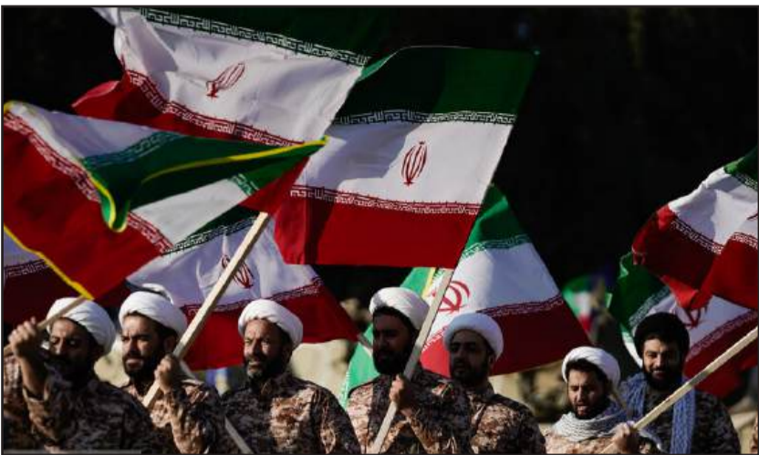
حضور فرمانده کل سپاه در تجمع پیشمرگه ها و بسیجیان لشکر ۲۹ نبی اکرم