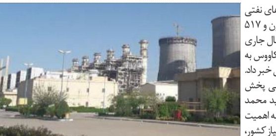
انبار نفت گنبد