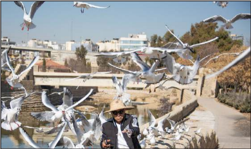
کاکایی‌ها مهمان زمستانی شیراز