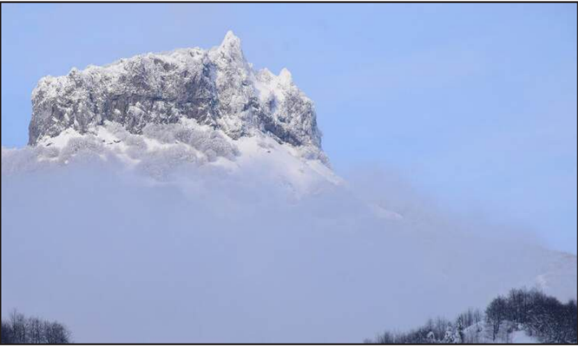
آبشار «لاتون» - آستانرا