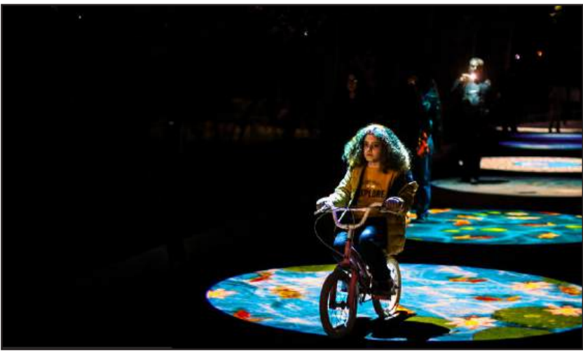
افتتاحیه جشنواره نور تهران - بوستان ملت

شعار جهش تولید در بزرگترین کارخانه فولادی کشور رنگ واقعیت به خود گرفت