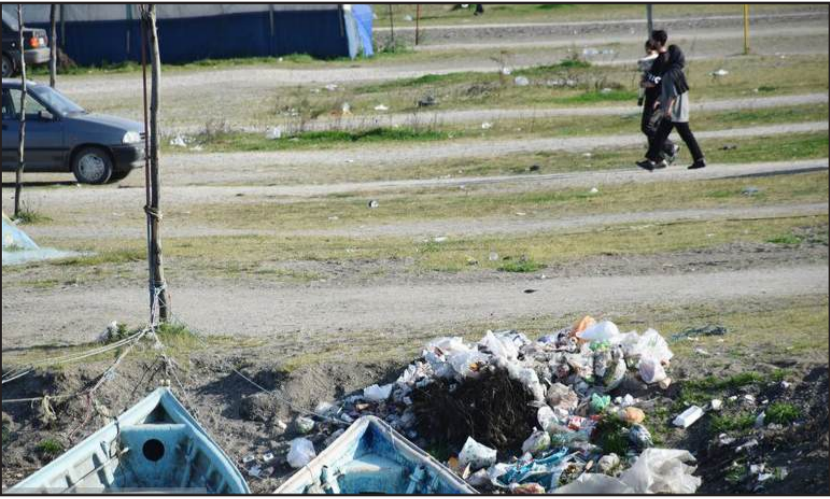
زباله هدیه مسافران نوروزی به استان گیلان