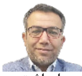
استراتژی برنده در سرمایه‌گذاری یادداشت