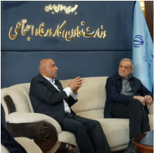
رئیس‌جمهور و وزیر تعاون، کار و رفاه اجتماعی

فشار کمبود عرضه بر بازارهای جهانی جدی است تحلیلگر بین‌المللی بازار نفت و انرژی اظهار داشت: در نتیجه این اقدامات، امروز بازارهای انرژی جهان با کمبود و دشواری در دسترسی به منابع انرژی روبه‌رو شده‌اند. جنبانی افزود: تحلیلگران پیش‌بینی کرده بودند که در سال ۲۰۲۶ تقاضا به‌طور میانگین حدود ۷۵۰ هزار بشکه در روز از میزان عرضه پیشی بگیرد. این در حالی است که در سپتامبر ۲۰۲۵ پیش‌بینی شده بود بازار نفت با مزاد عرضهای در حدود یک میلیون و ۶۳۰ هزار بشکه در روز مواجه خواهد شد.