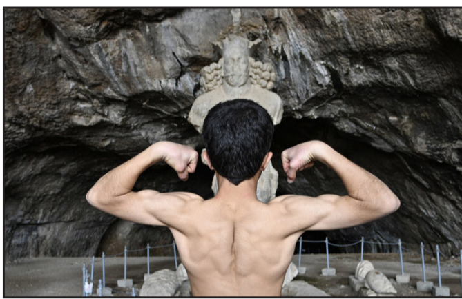
مجسمه شاپور؛ نماد استقامت و تمدن ایرانی - کازرون