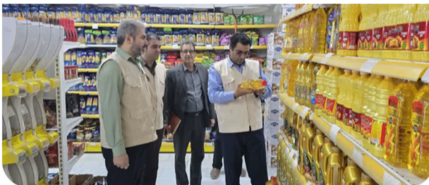
مهم‌ترین اولویت‌های مدیریت شهرستان است و تمامی دستگاه‌های مسئول با هماهنگی

کامل، روند رصد و پایش بازار را به‌صورت مستمر دنبال می‌کنند. وی افزود: در شرایط حساس کنونی که دشمنان تلاش می‌کنند با جنگ ترکیبی و فشارهای اقتصادی، آرامش جامعه را هدف قرار دهند، حفظ ثبات بازار و مقابله با هرگونه سوءاستفاده احتمالی از اهمیت ویژه‌ای برخوردار است. از این رو، هرگونه کم‌فروشی، گران‌فروشی، احتکار، عرضه خارج از ضوابط و سایر تخلفات صنفی با قاطعیت پیگیری و مطابق قانون با متخلفان برخورد خواهد شد. فرماندار بردسکن با اشاره به نقش مهم اصناف در حفظ آرامش اقتصادی جامعه تصریح کرد: بخش عمده فعالان صنفی شهرستان همواره همراه مردم و پایبند به قانون بوده‌اند و انتظار می‌رود همه واحدهای صنفی با رعایت مقررات، در تأمین نیازهای عمومی و حفظ اعتماد اجتماعی مشارکت مؤثر داشته باشند.